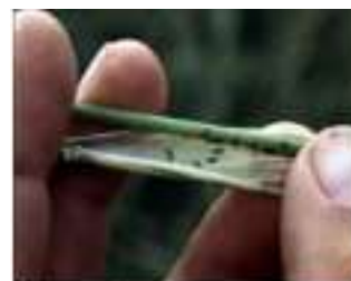
Trips i rug.