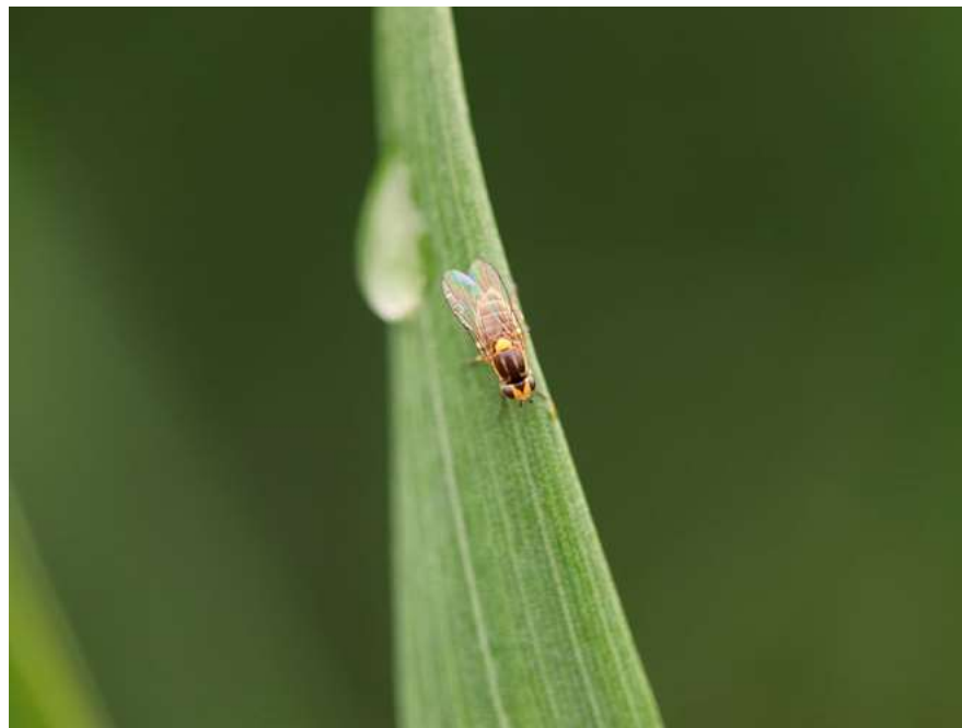
Bygfluen er 4-5 mm lang