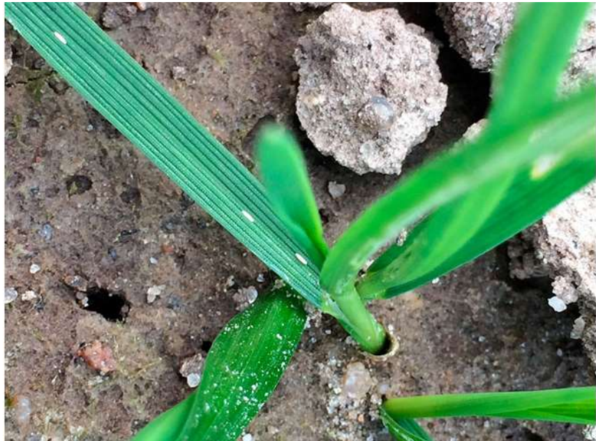
Bygfluens hvide æg ses på blad.

Da flyvningen kan strække sig over en længere periode, kan 2 behandlinger med ca. 10 dages mellemrum være aktuel. Ved erfaring for meget kraftige angreb, kan 3 behandlinger være aktuel.